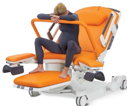
Assise, accoudée à la barre