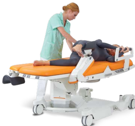
Couchée sur le côté