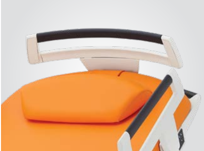
Tête de lit amovible