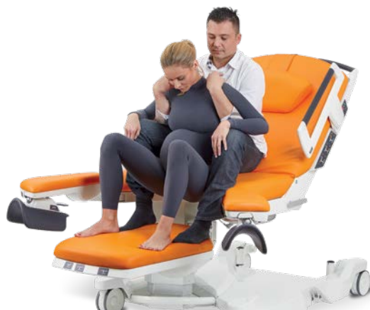
Semi-assise avec l'aide de son partenaire