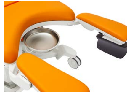
Sliding stainless catch basin 4.5l