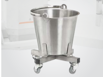
Seau à placenta sur roulettes