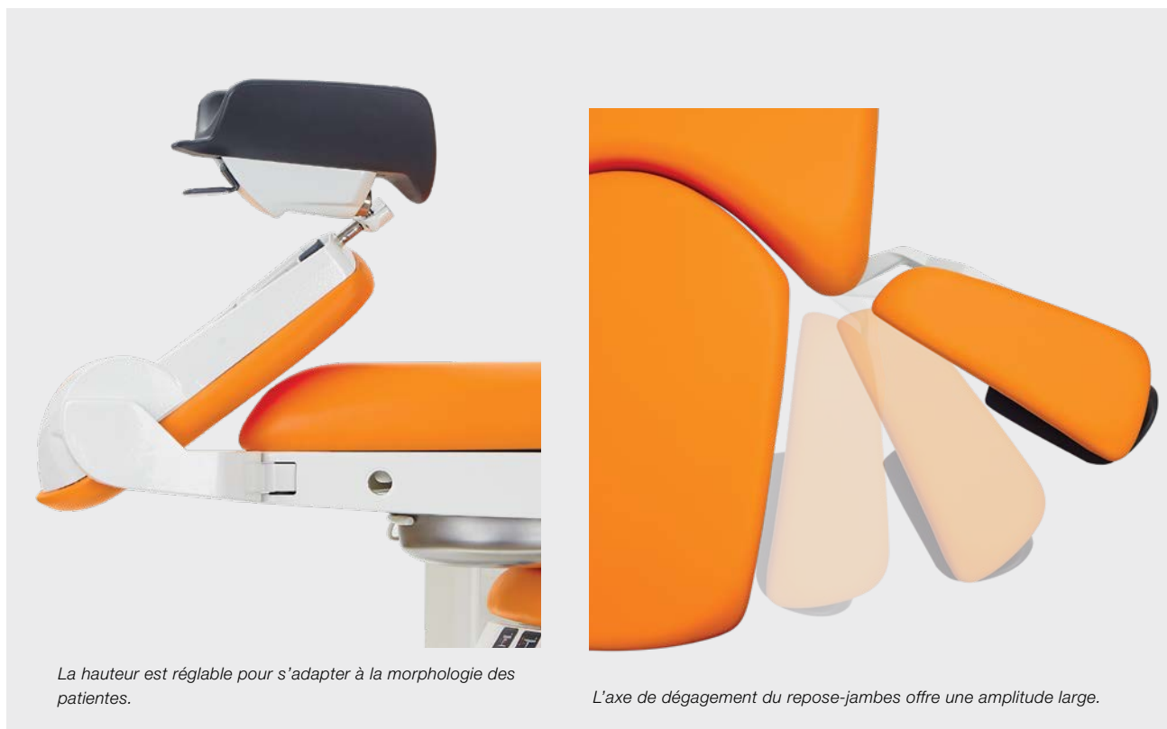
La hauteur est réglable pour s'adapter à la morphologie des patientes.