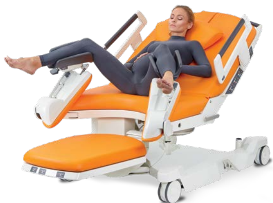
Position gynécologique passive