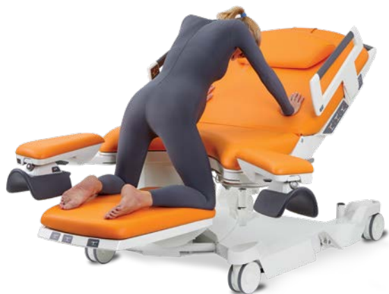
A genoux en appui sur bras