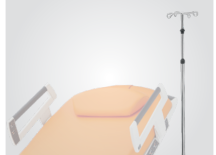
Tige à perfusion