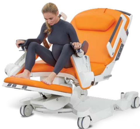
Semi-assise en appui sur les repose-jambes