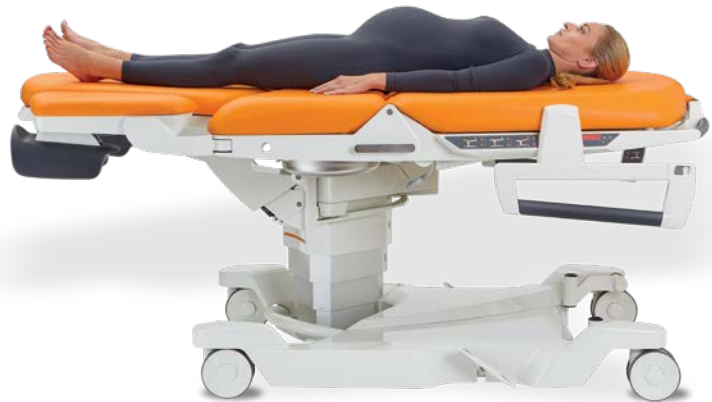
Remise à plat d'urgence du relève buste