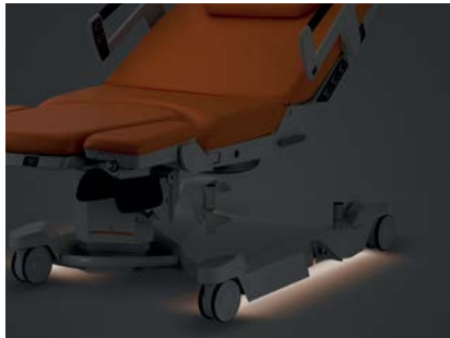
Veilleuse de nuit