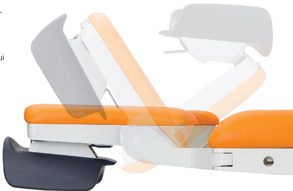
Réglage rapide des repose-jambes.

L'amplitude des axes de positionnement des repose-jambes permet à l'équipe soignante de répondre très rapidement et efficacement aux différentes situations qui peuvent se produire lors de l'accouchement.