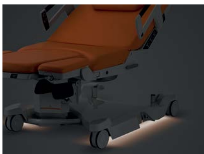
Lampje onder het bed