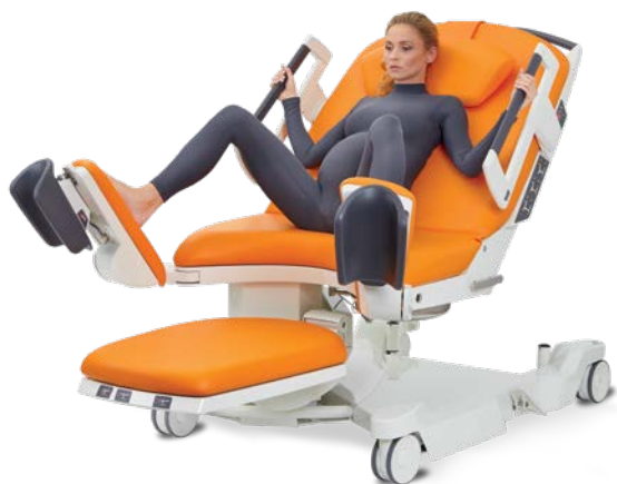
Halfzittende houding met voeten op de beensteunen