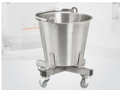
Roestvrijstalen kom met wieltjes