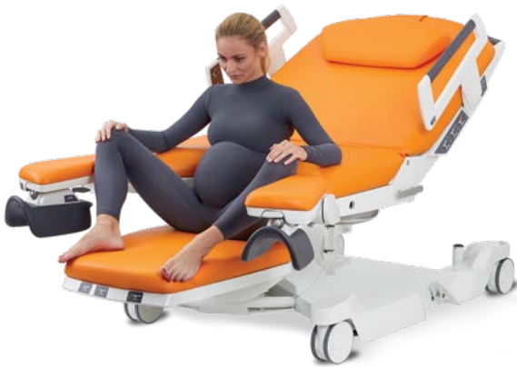
Halfzittend gebruikmakend van de voetsteunen