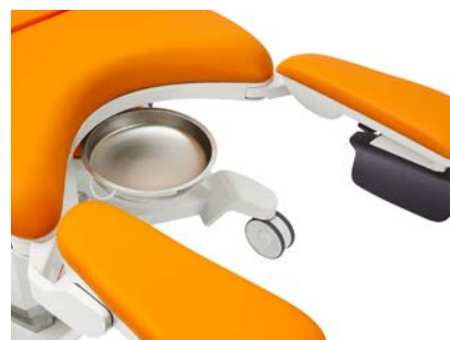
Roestvrijstalen opvangbak 4.5 l