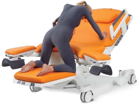
Op handen en voeten