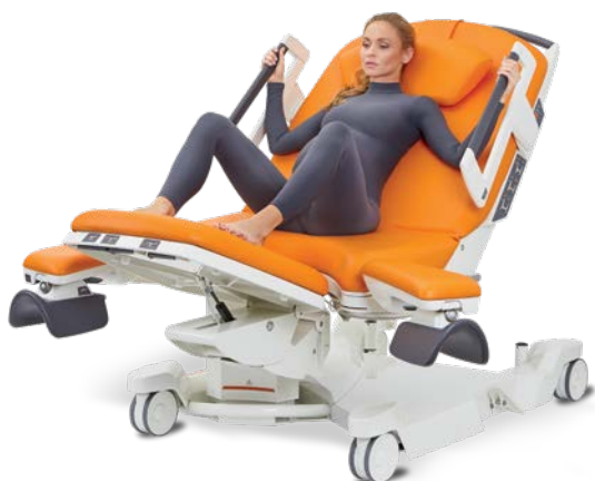
Halfzittende houding met voeten rustend op de voetsteunen