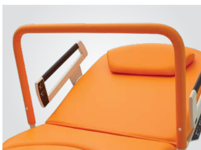
Ondersteunende beklede stang